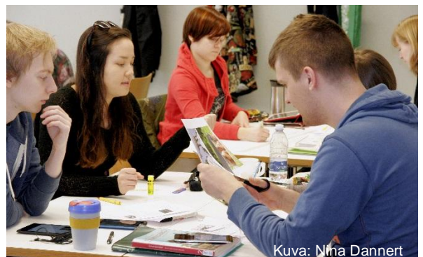
Kuva: Nina Dannert